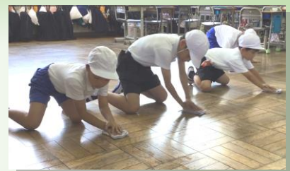
伝統の「三拍子拭き」で、床を磨く子どもたち

「石城太鼓」「三輪行進」「東荷神舞」と、旧塩田小・旧三輪小・旧東荷小の伝統を受け継ぐ取組は動き始めました。では、旧岩田小の伝統とは何でしょうか。旧岩田小の誇れる取組の一つに「無言清掃」があります。「無言清掃で、そうじ日本一の学校をめざそう」と15年ほど前から受け継がれてきた取組です。本校でも、9月から縦割り班での無言清掃が本格的に始まりました。上級生が手本を示し、下級生がそれを真似る。とてもすてきな姿が見られています。床を磨き、心を磨き、そして大和小の伝統として磨きをかけていってほしいと願っています。