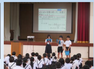
6年生による チャレンジ目標の発表

各学級からの意見をもとに代表委員会及び6年生での再協議をとおして、本年度のチャレンジ目標が決まりました。大和小学校を自分たちの手でよりよくするために生まれた目標です。保護者・地域の皆様にもご承知おきいただき、子どもたちを応援していただければ幸いです。